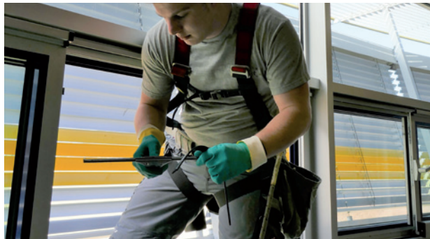
Durchführung von Reinigungsmaßnahmen